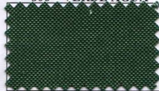
809 - VERDE FOLHA