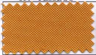
807 - OURO