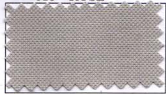
819 - CINZA

. LAVAR COM SABÃO NEUTRO . NÃO MISTURAR CORES CLARAS COM CORES ESCURAS . NÃO USAR PRODUTO QUE CONTENHA CLORO