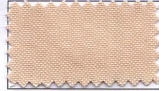
803 - BEGE