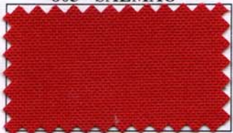
808 - VERMELHO