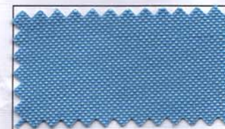
811 - CELESTE