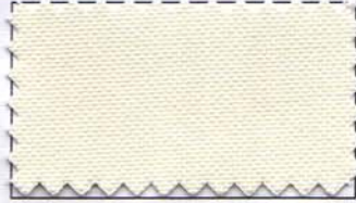
802 - PEROLA