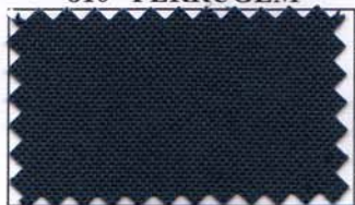
813 - MARINHO