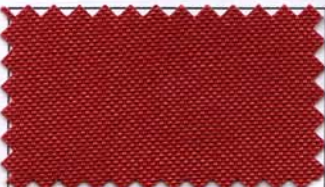
810 - FERRUGEM