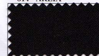
817 - PRETO