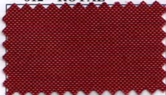
815 - VINHO