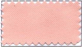
804 - PESSEGO