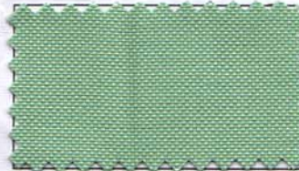
806 - VERDE AGUA