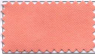
805 - SALMAO