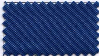
812 - ROYAL