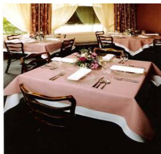
LINHO OXLIN ou CREPE