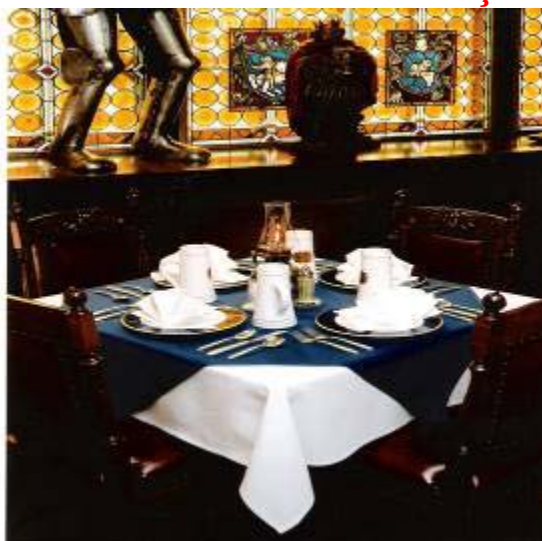
LINHO OXLIN ou CREPE